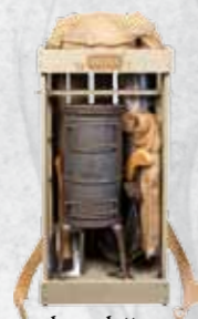
komplett, Gesamtgewicht 20 kg