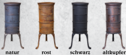
natur rost schwarz altkupfer