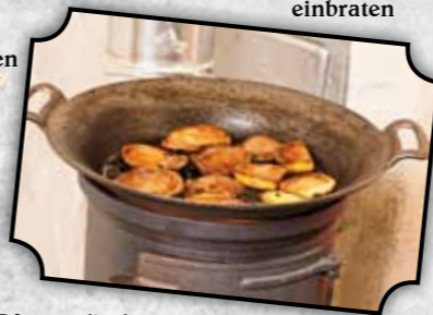
Pfanne direkt ins Feuer

Pfanne mehrfach mit Fett, Salz und rohen Kartoffelscheiben einbraten