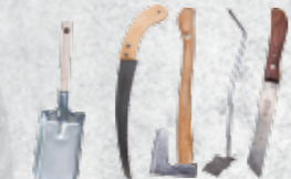
Schaufel Säge, kleines Beil, Ofenbesteck, Messer